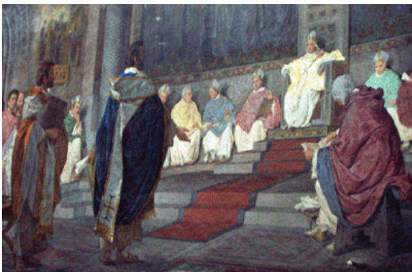
(Beide broers op bezoek bij paus Adrianus II)

De wens van de paus om het westerse Slavische volk onder zijn invloed te behouden en om een herhaling, zoals bij het Bulgaarse volk, dat de kant koos van de Byzantijnse kerk, te voorkomen deed hem beslissen om alle wensen van Cyrillus en Methodius in te willigen. De paus erkende officieel de Slavische boeken en gaf aan de beide broers het recht om de christelijke leer in de Slavische taal te prediken echter op voorwaarde dat in de kerken het evangelie en de apostelen eerst in het Latijn gelezen zouden worden.