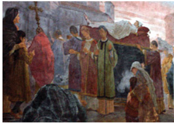
(uitvaart van Cyrillus in Rome)

Daartegenover verklaarden zij zich bereid om de suprematie van de paus te erkennen.